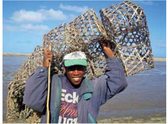
الشكل رقم 18: عادة ما تكون السجلات المالية لصيد الأسماك بغرض جلب الرزق غير متاحة لدعم المطالبة. ويمكن أحياناً استخدام مصادر وسبل أخرى للحصول على المعلومات في تحديد الخسائر.

وحيثما وجدت السجلات، يجب إعطاء نسخ من الحسابات المالية لفترة ثلاث سنوات على الأقل قبل الحادث، لتتيح فهم العمل التجاري وأنماط التداول العادية وأية تأثيرات على الدخل نتيجة الانسكاب النفطي (الشكل رقم 19 والشكل رقم