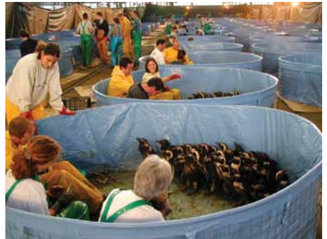
▲ الشكل رقم 8: يمكن أن تولد عملية تنظيف الحياة البرية وإعادة تأهيلها متطلبات كبيرة. وقد تتضمن التكاليف تدفئة المرافق وإضاءتها، والملابس الواقية للعمال وطعام الطيور.