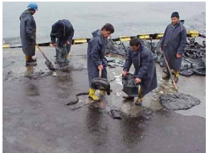
▲ الشكل رقم 3 والشكل رقم 4 تتطلب المطالبات بتكاليف عمليات التنظيف كثيفة العمالة والخسائر المرتبطة بعمليات الصيد أنواعًا مختلفة من الوثائق الداعمة.

ويمكن أن ترسل الجهة الملزمة بدفع التعويضات ممثلًا إلى الموقع إذا كان ذلك مناسبًا. وعادة يكون هذا الممثل في صورة المراسل المحلي لشركة التأمين أو من شركة المسح المحلية. وفي بعض الولايات القانونية، قد يتم حشد منظمات أخرى، مثل فرق إدارة الانسكاب. كما قد تعين شركة التأمين أو الصناديق الدولية للتعويض عن التلوث النفطي خبراء، ومنهم خبراء من الاتحاد الدولي المحدود