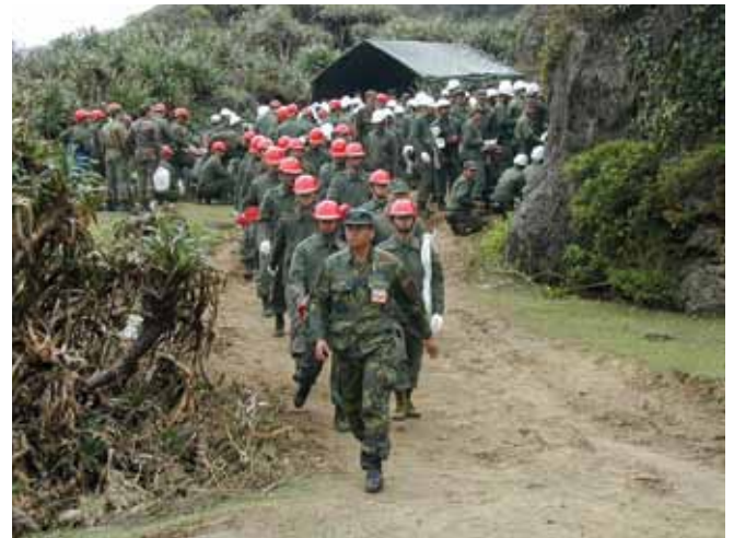
الشكل رقم 9: أفراد عسكريون تم حشدهم للمساعدة في عملية تنظيف السواحل. وقد يقوم الجيش بتقديم مطالبة مباشرة بالتكاليف المرتبطة بمشاركتهم أو قد يتم ذلك من خلال مطالبة أشمل تقوم بها الحكومة.

قد يحق للعديد من المنظمات والأفراد المطالبة بتعويض في أعقاب الانسكاب النفطي مما يمكن أن يؤدي، في حالة الحوادث الكبيرة، إلى مئات أو آلاف المطالبات.