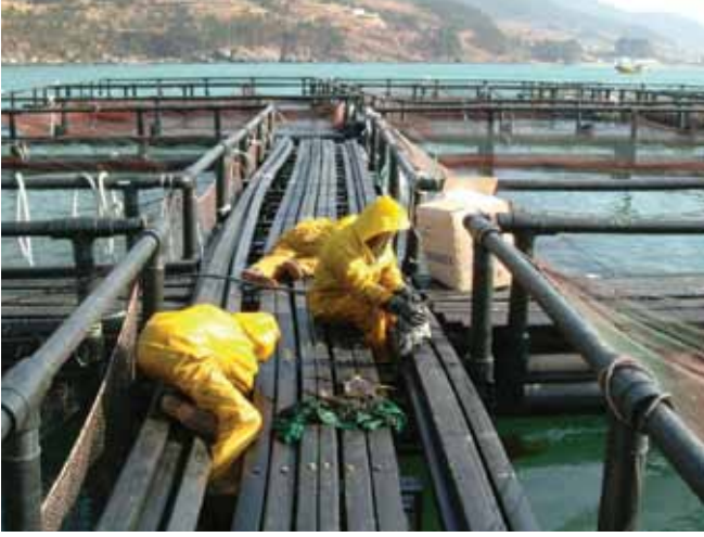
الشكل رقم 16: قفص أسماك ملوث بالنفط يجري تنظيفه. وقد تؤدي أية خسائر في الدخل تنتج عنه إلى مطالبات نتيجة الخسائر الاقتصادية التابعة.