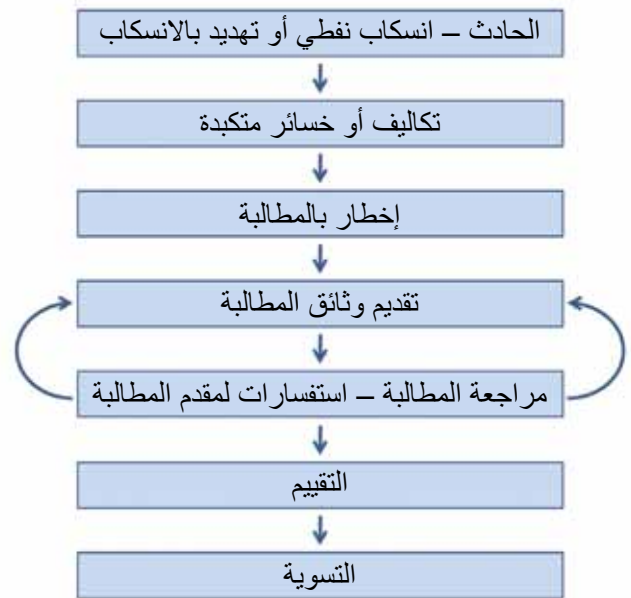
▲ الشكل رقم 2: الخطوات المعتادة التي يتم بها تسوية المطالبات البسيطة. وقد تنطوي الحوادث أو المطالبات المعقدة على خطوات أخرى غير مبيّنة، مثل الاستبيانات والتقييمات المتتالية.

المثال، قد يستغرق تجميع المطالبة، بما فيها من تكاليف متكبدة من قبل المنظمات المختلفة أو تجميع الوثائق الداعمة من مختلف المصادر، وقتًا طويلاً نسبياً. ومن المفيد لجميع الأطراف أن يتم تقديم إخطار رسمي من الجهة المقدمة للمطالبة إلى مالك المركب، أو نادي الحماية والتعويض أو شركة تأمين أخرى بنية تقديم المطالبة، في أقرب وقت ممكن من الناحية العملية بعد تكبد الخسائر. وطبقاً لظروف الحادث، قد يلزم أيضًا إرسال إخطار رسمي إلى الصناديق الدولية للتعويض عن التلوث النفطي أو أنظمة التعويضات الوطنية ذات الصلة. وفي الحوادث واسعة النطاق، يمكن تقديم النصح بشأن أسلوب الإخطار من خلال وسائل الإعلام المحلية، وقد يُنشأ مكتب للمطالبات محليًا لتيسير العملية.