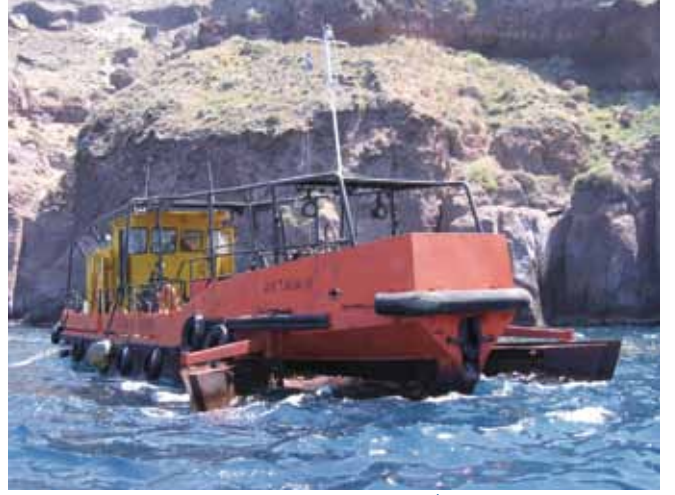
الشكل رقم 12: يجب أن تُبنى تكاليف استخدام مراكب الاستجابة المتخصصة على تكاليف تشغيل المركب مع ترك هامش للربح عندما ينطبق هذا.

قد تتضمن الاستجابة نطاقًا واسعًا من الموظفين، منهم المستشارون المتخصصون ومقاولو انسكاب النفط وأطقم الطائرات والمراكب وموظفو الصناعة والحكومة، وموظفو الوكالة وخدمات مكافحة الحرائق والإنقاذ والشرطة والجيش والسكان المحليون والمتطوعون. وتتباين تكلفة مشاركتهم بشدة، ويرجع ذلك بصورة أساسية طبقًا لمستويات المعيشة المحلية ومستويات التدريب وأدوارهم ومسؤولياتهم في الاستجابة.