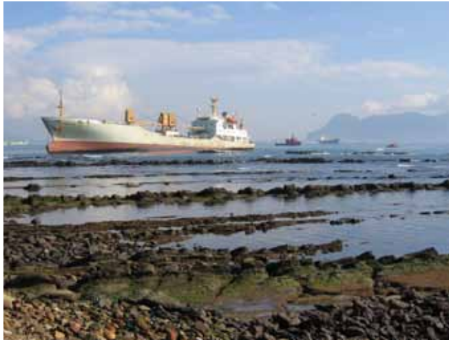
الشكل رقم 1: في حالة انسكاب النفط من سفينة، قد تكون هناك تعويضات متاحة من عدد من المصادر نظير الخسائر المتكبدة، طبقاً للنظام القانوني المطبق.

التي يتم من خلالها تقييم المطالبات أو تسويتها، والغرض منها هو تكملة كتيبات المطالبات وليس أن تحل محلها. كما أن المطالبات نظير إزالة النفط المتبقي في حادث أو حطام غير متضمنة.