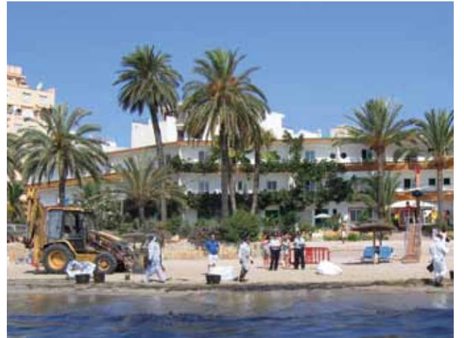
الشكل رقم 17: قد يؤثر تنظيف شاطئ سياحي على إجمالي عدد زوار المنطقة ويؤدي إلى مطالبات نتيجة الخسائر الاقتصادية المحضة لعدد من الأعمال التجارية.

وقد تفرض السلطات، كإجراء احترازي لحماية الصحة العامة، قيوداً على أنشطة مصايد الأسماك وعلى بيع التجار والفنادق والمطاعم من المنطقة الساحلية المتضررة من الانسكاب النفطي لمنتجات الأطعمة البحرية. ويجب إدارة أي قيود تقرض على مصايد الأسماك من منظور فني لضمان فهم معايير فرض القيود والإبقاء عليها، ورفعها، بوضوح. ويجب أن تشمل المطالبات الخاصة بتعطيل الأعمال التجارية كنتيجة للقيود المفروضة على مصايد الأسماك نسخاً من الإشعارات ذات الصلة الصادرة عن السلطات. ويجب ملاحظة أنه بالرغم من أن قيود مصايد