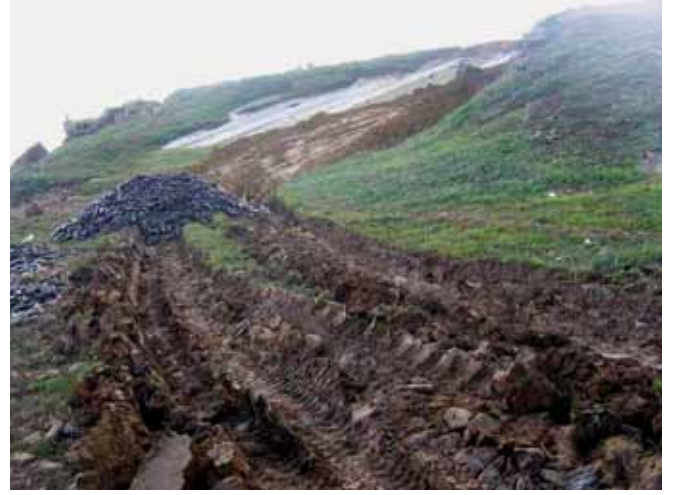
الشكل رقم 15: حقل تم إتلافه بشدة من جراء حركة المعدات الثقيلة من وإلى السواحل الملوثة بالنفط. ويمكن أن يستلزم تقديم مطالبات لاستعادة الأوضاع إلى طبيعتها إجراء مسح لإثبات مدى التلف تحديداً وأية تحسينات قد تنتج من العمل.