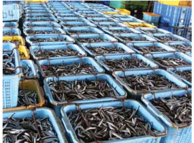
الشكل رقم 19: حصيلة الصيد في انتظار البيع في سوق للأسماك. وسوف تساعد تفاصيل أرقام البيع في تقييم أية مطالبات نتيجة خسائر نتجت من انسكاب نفطي.