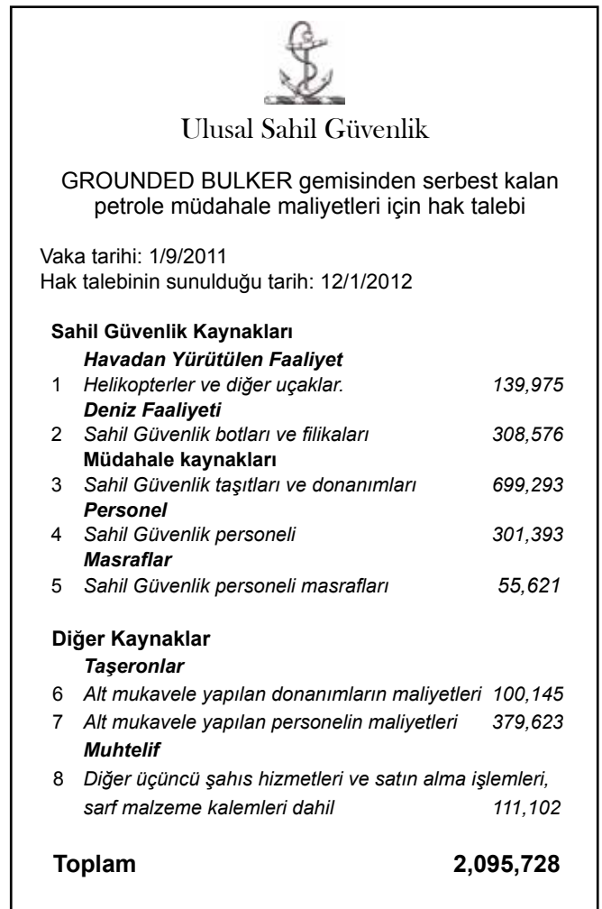
▲ Şekil 10: Bir hak talebinin alışlageldik bileşenlerini gösteren, bir ulusal sahil güvenlik kurumundan temizlik maliyeti için bir hak talebinin örnek özeti.

Hak talebinin her bir bileşeninin donanımların ve işçilerin ayrı ayrı kalemlerini listeleyen ayrıntılı bir hesabın ilgili destekleyici belgelere atıfta ayrı bir tabloda (Şekil 11) listelenmesi gerekmektedir. Hak talebinin karmaşıklığına bağlı olarak ek tablolar gerekli olabilmektedir. Destekleyici belgelerin hak talebinin ilgili bileşenine göre sıraya koyulması