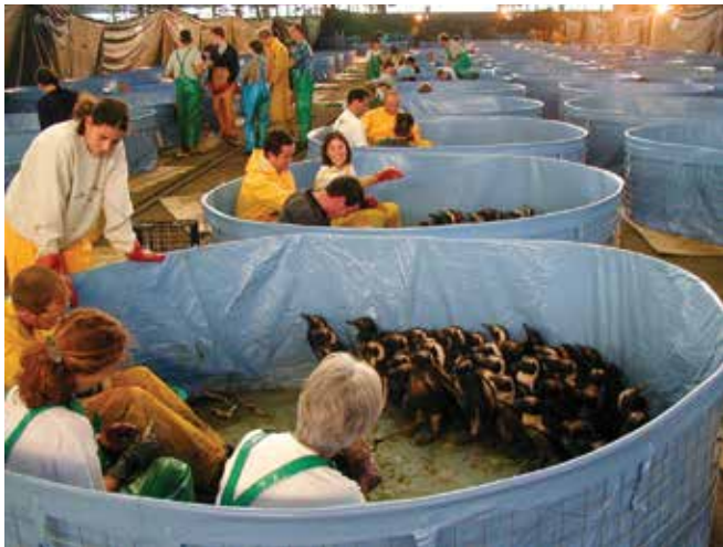
▲ Şekil 8: Yaban hayatında temizlik ve ıslah büyük hak talepleri meydana getirebilmektedir. Maliyetler tesislerin ısıtılması ve aydınlatılmasını, işçilerin koruyucu elbiselerini ve kuşlar için yemi içerebilmektedir.

Bir müdahalede kullanılan personel ve donanımların çoğu son derece hareketlidir ve bir gün içerisinde birçok saha arasında hareket edebilmektedir, örneğin gelgitlerle aralarında uyum sağlamak için çeşitli görevlerde plana göre yerleştirilebilmektedir ve atık çöp konteynırları sahil şeridi ve atık depolama ve bertaraf alanları arasında düzenli olarak aktarılabilir. Geniş bir alanı veya uzun bir mesafeyi kapsayan bir vakada, belirli bir kaynağa bir kod veya etiket tayin edilmesi ve o kaynağın hareketleri elektronik olarak