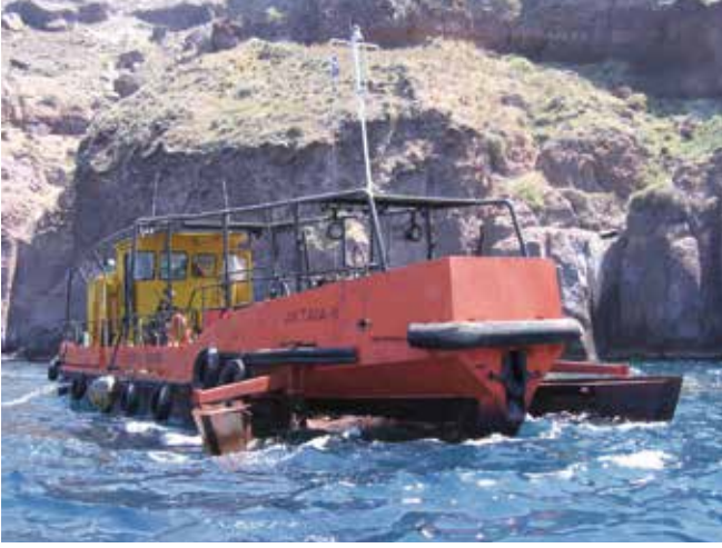
▲ Şekil 12: Belirli bir amaca uygun olarak üretilmiş müdahale gemilerinin kullanım maliyetlerinin uygulanabilir olduğu hallerde kar için bir ihtiyat payıyla birlikte bir geminin işletme maliyetlerini temel alması gerekmektedir.

orantılı olarak daha düşük sabit maliyetleri yansıtmaya uygun olabilmektedir. Donanımlar için bir tanım veya talimat sayfasının hak talebine eklenmesi gerekmektedir.