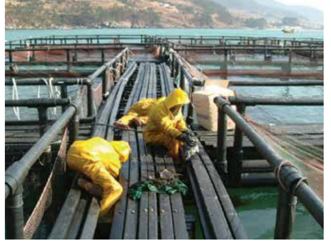
▲ Şekil 16: Temizliğe giden, petrol bulaşmış olan bir balık kafesi. Sonuç olarak ortaya çıkan herhangi bir gelir kaybı, sonuç olarak ortaya çıkan mali kayıp nedeniyle bir hak talebine yol açabilmektedir.