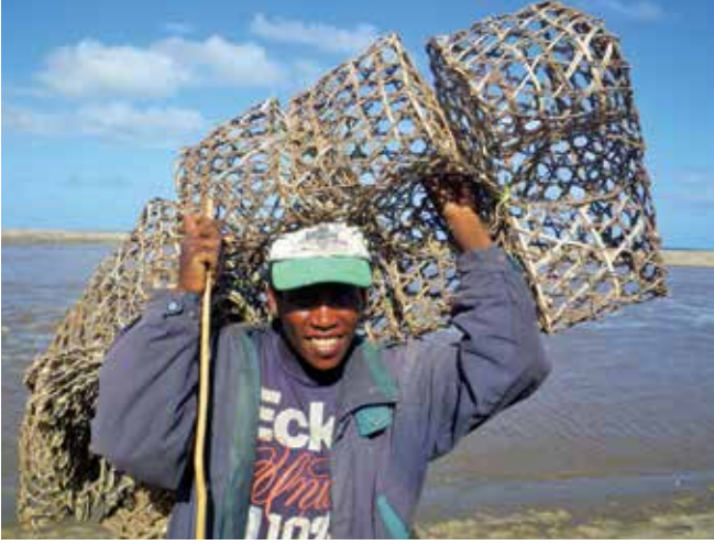
▲ Şekil 18: Geçim kaynağı olarak yapılan balıkçılıkla ilgili bir hak talebinin desteklenmesi için mali kayıtlar genellikle mevcut olmamaktadır. Bazen zararların tespit edilmesi için başka araçlar ve bilgi kaynakları kullanılabilir.