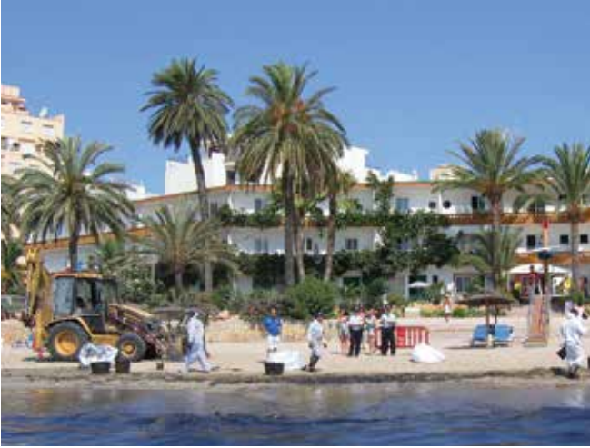
▲ Şekil 17: Turistik bir sahilde temizlik, bölgedeki genel ziyaretçi sayısını etkileyebilmektedir ve birtakım ticari faaliyetler için safi mali kayıp nedeniyle hak talepleriyle sonuçlanabilmektedir.

ve turizm sektörlerinden sunulmaktadır. Dünya çapında bu ticaret sektörlerinden çok çeşitli mali ve işletme düzenlemeleri benimsenmiştir ve sonuç olarak hak talebinde bulunan belirli bir kişinin mali kayıp için bir hak talebini destekleyici olarak verebileceği tam bilgiler çok çeşitli olmaktadır ve kaybın özel durumlarına bağlı olmaktadır. Bu nedenle, aşağıdaki bilgilerde, balık üretme çiftlikleri ve deniz ürünleri üretme tesislerinin hak talepleri üzerine özel bir vurguda bulunularak mali kayıplar nedeniyle hak talepleriyle ilgili daha yaygın konuların üzerine odaklanılmaktadır