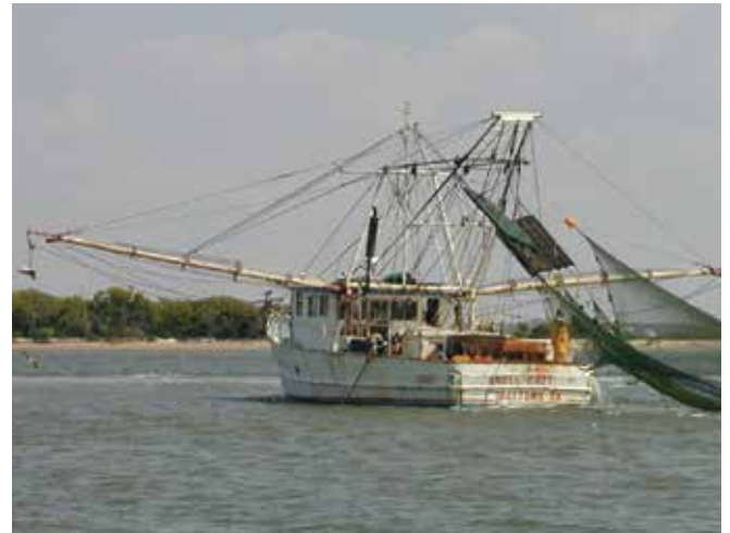
▲ Şekil 3 ve Şekil 4: Yoğun işgücü gerektiren temizlik çalışmalarının maliyetleri ve balıkçılık çalışmalarıyla ilgili zararlar için hak talepleri farklı türlerde destekleyici belgeler gerektirebilmektedir.