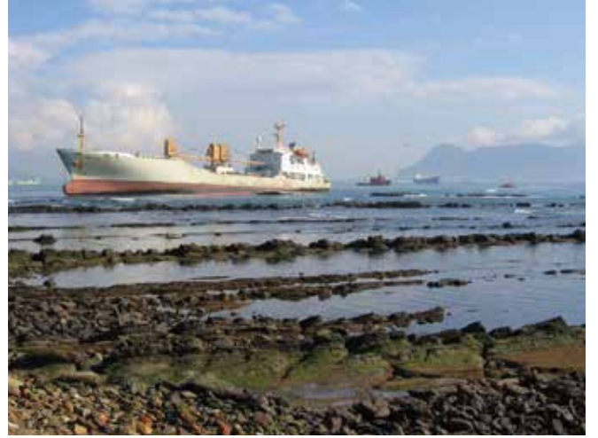
▲ Şekil 1: Bir gemiden petrolün kazara dökülmesi halinde, maruz kalınan zararlar için tazminat, uygulanabilir yasal sisteme bağlı olarak birkaç kaynaktan elde edilebilmektedir.

hak talepleri kılavuzlarında verilen rehberliğin yerini almaktan ziyade destekleme amacındadır. Bir enkazda veya batıkta geriye kalan petrolün kaldırılması için hak talepleri de göz önünde bulundurulmamaktadır.