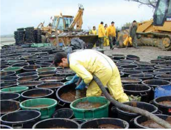
▲ Şekil 14: Atığın yüklenip-boşaltılması, depolanması, nakliyesi, arıtılması ve bertarafı maliyetli olabilmektedir. Toplanan, taşınan ve arıtılan atık miktarlarının kaydedilmesine özel dikkat gösterilmelidir.