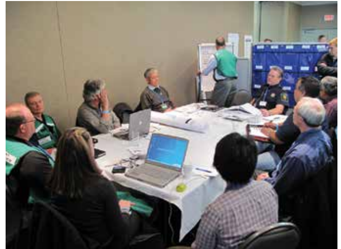
► Şekil 5: Herhangi bir toplantının müdahale seçeneklerinin tartışılması ve hakkında karar verilmesi için tutulan tutanaklarının bir hak talebinin desteklenmesi için belgelere dahil edilmesi gerekmektedir.

Bilgi, bir müdahalenin etkili yönetimi, komutası ve liderliği için anahtar olmaktadır. İlerleyen bir vakanın ilk bildiriminden itibaren bilgiler kamu üyeleri, sahada çalışan müdahale takımı ve harici kuruluşlar dahil olmak üzere çeşitli kaynaklardan tayin edilen irtibat noktasınca alınacaktır. Bu bilgilerin kaydedilmesi için usullerin gelecekte başvurulacak şekilde mantıksal ve yöntemsel bir şekilde oluşturulması gerekmektedir. Asgari olarak, bilginin alınma tarih ve zamanı ve kaynağının not edilmesi gerekmektedir. E-posta veya başka bir elektronik araçla alınan bilgilerin uygun bir şekilde saklanması ve listesinin hazırlanması ve gerektiğinde çıktısını alınması gerekmektedir.