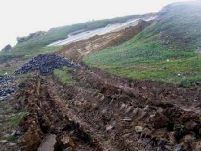
▲ Şekil 15: Petrol bulaşmış olan sahil şeridine giren ve çıkan ağır iş makinelerinin hareketiyle ciddi bir şekilde hasar gören bir alan. Alanın onarımı için bir hak talebi gerçek hasar seviyesinin ve işten kaynaklanabilecek olan herhangi bir iyileştirmenin tespit edilmesi için bir tetkik gerektirebilecektir.