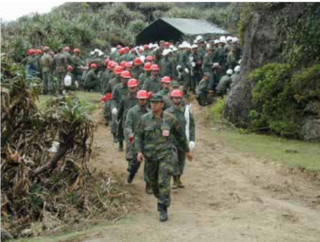
▲ Şekil 9: Sahil şeridi temizliğine yardım etmek için seferber edilen askeri personel. İşin içine dahil olmalarının ilgili maliyetleri için bir hak talebi doğrudan ordu tarafından veya daha geniş bir hükümet hak talebinin bir parçası olarak yapılabilmektedir.

Hak talepleri hazırlığının düzenlenmesi ve eşgüdümü, maliyetlerin ihmal edilmemesi veya iki defa yazılmamasının sağlanması için önem arz edecektir. Bazı durumlarda, öncü kuruluşlar bireylerin ve diğer kuruluşların hak taleplerinin birleştirildiği tek bir hak talebi sunmayı seçebilmektedir (Şekil 9) ve bu hak taleplerinin değerlendirilmesinden sorumlu olanlar için faydalı olabilmektedir. Buna rağmen, birçok durumda, ayrı hak taleplerinin birleştirilmesi uygun olmayabilmektedir veya hak talebinde bulunanlar bireysel olarak sunayı tercih edebilmektedir. Bu gibi durumlarda, sunulan hak talepleri karmaşıklık ve nitelik olarak muazzam bir şekilde değişiklik gösterebilmektedir.