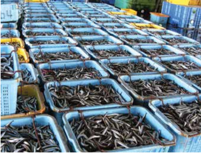
▲ Şekil 19: Bir balık pazarında satılmayı bekleyen av. Ayrıntılı satış rakamları kazara dökülen petrolün bir sonucu olarak kayıplar nedeniyle herhangi bir hak talebinin değerlendirilmesine yardımcı olacaktır.