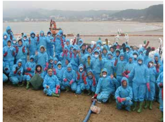
▲ Şekil 13: Bir müdahaleye gönüllülerin büyük ölçekli katılımı koruyucu donanımlar, gıda ve barınma için kayda değer maliyetlere maruz bırakabilmektedir.

Müdahalede sarf malzemelerinin veya satın alınan kalemlerin kullanımının nedeninin, kullanım tarihlerinin ve yerlerinin ve satın alma maliyetinin tamamının kaydedilmesi gerekmektedir. Merkezi ambarlardan yerel dağıtım alanlarına ve özel çalışma sahalarına kadar özellikle emici madde ve koruyucu kişisel malzemelerin hacimli satın almalarının takip edilmesi bilhassa büyük bir müdahalenin acil durum müdahale aşaması boyunca zor olabilmektedir. Bu nedenle, doğruluğun sağlanması amacıyla uygun deneyimli ikmal personelinin göreve tahsis edilmesi gerekmektedir. Satın alma emirleri, ambar stok çıkış formları, envanter raporları, faturalar ve makbuzların uygun bir şekilde muhafaza edilmesi ve dizinlenmesi gerekmektedir. Yakıt için makbuzlara satın alma işleminin gerçekleştirildiği müdahale gemisinin, taşıtının veya donanımın kimliğini açıklayıcı notlar yazılması gerekmektedir.